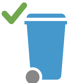
dentro de contenedores azules normalizados*