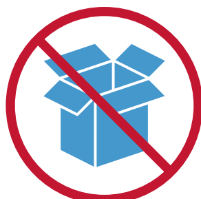
nunca en el suelo sin plegar